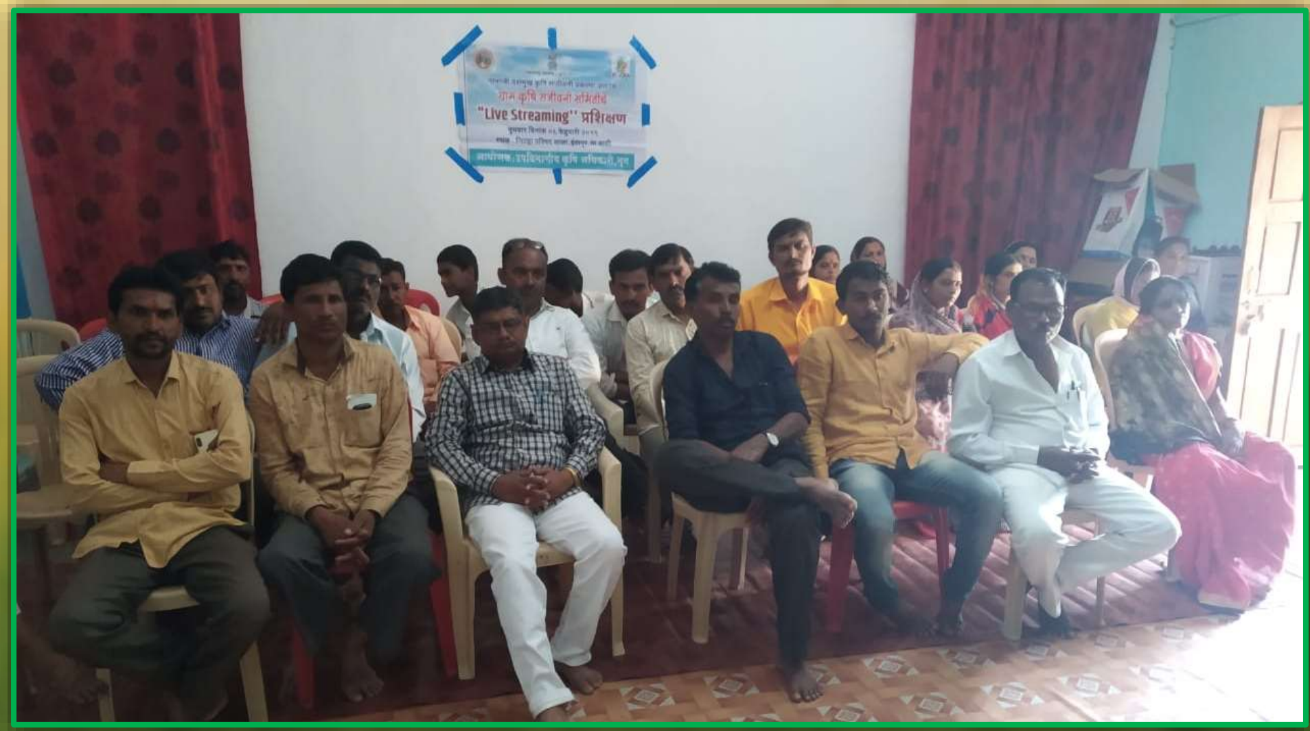
Indapur Washi, Osmanabad