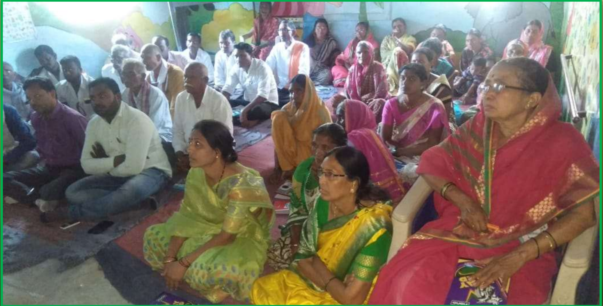
चिखली ता. आर्णी जी. यवतमाळ