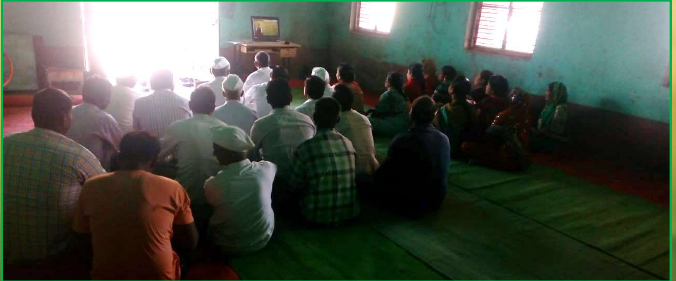
Warewadgaon / Navalgaon, Tal: Bhoom, Osmanabad