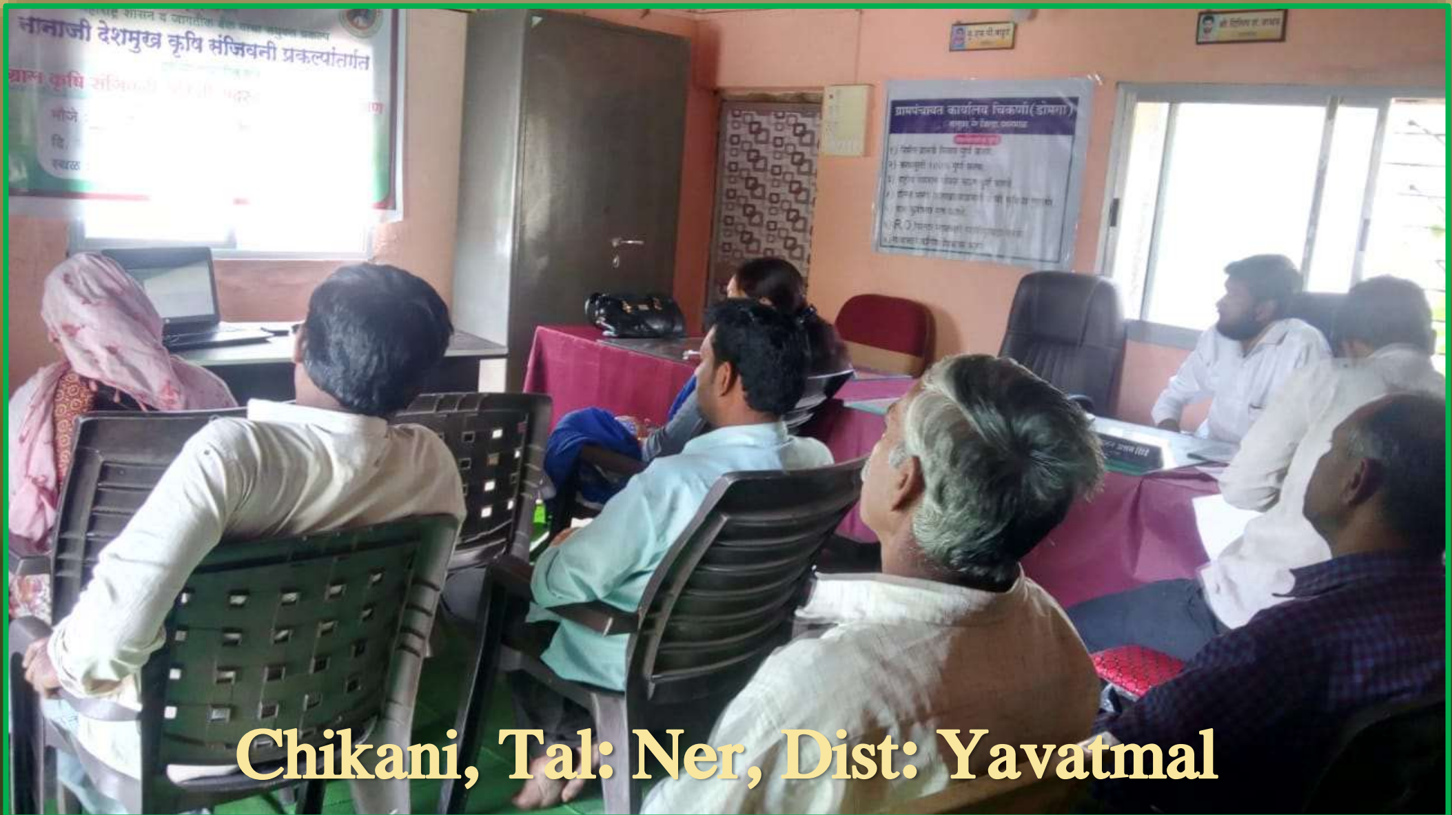
Chikani, Tal: Ner, Dist: Yavatmal