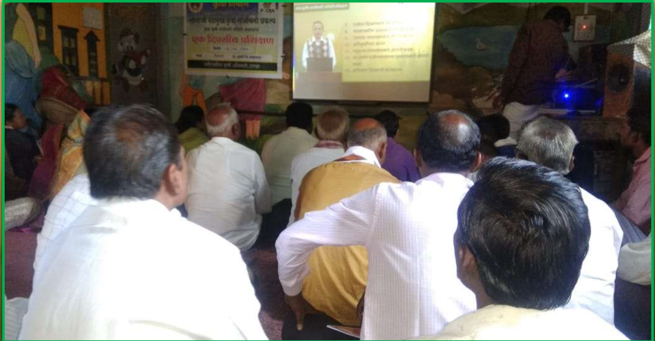
चिखली ता. आर्णी जी. यवतमाळ