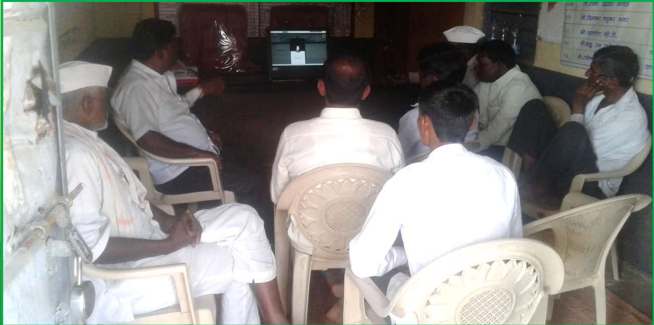
GPDapegaon, Tal: Ausa, Dist: Latur