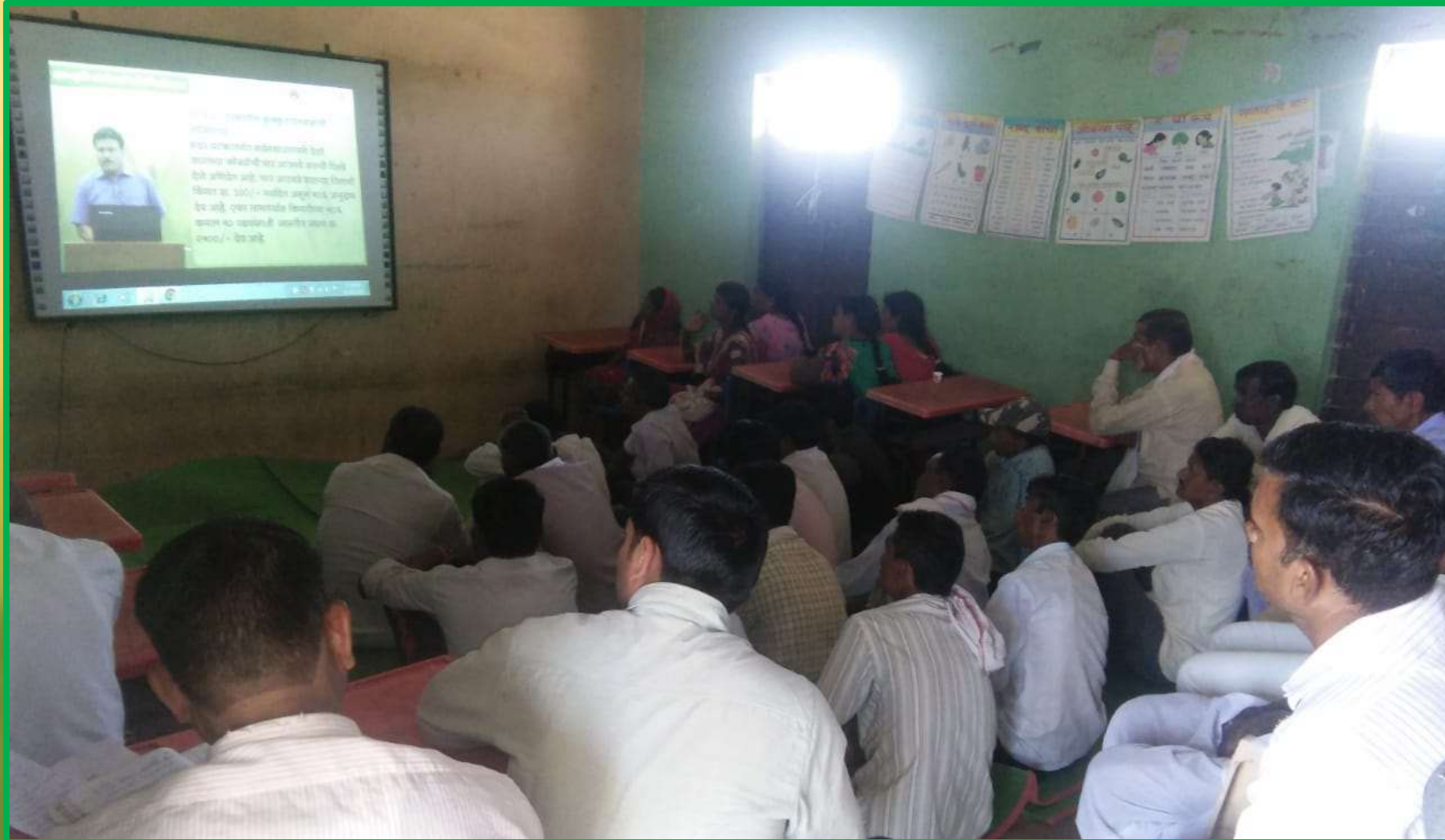
मुंगशी ग्रामपंचायत पं स माहुर